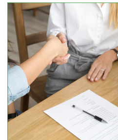
Осуществление индивидуальной предпринимательской деятельности