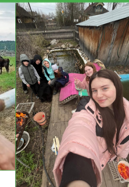
Преодоление трудной жизненной ситуации